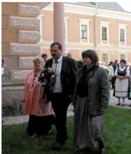
Am 25. April 2020 jährte es sich zum 75. Mal, dass aus den Komitaten Tolnau

und Branau ungarndeutsche Familien in der Früh geweckt und aus ihren Häusern verbannt wurden.